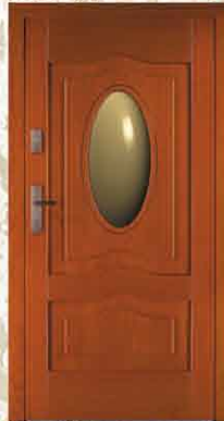
CAL 253 90

netto 2884,- brutto 3518,48 netto 3590,- brutto 4379,80