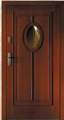
CAL 251 90

sosna netto 2784,- brutto 3396,48 dąb netto 3490,- brutto 4257,80