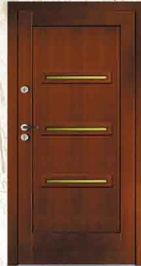
CAL 233 90, 80

netto 2784,- brutto 3396,48 netto 3490,- brutto 4257,80