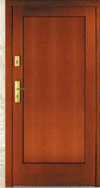
CAL 200 90, 80

netto 2400,- brutto 2928,00 netto 2990,- brutto 3647,80