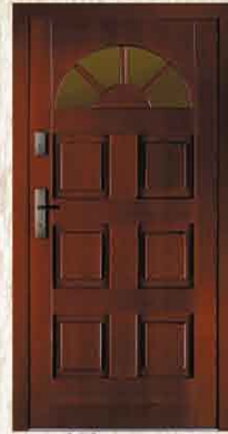
CAL 102 90

netto 2784,- brutto 3396,48 netto 3597,- brutto 4388,34