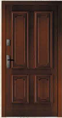
DZO 90, 80