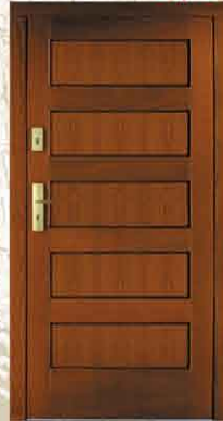
CAL 230 90, 80

netto 2516,- brutto 3069,52 netto 3250,- brutto 3965,00