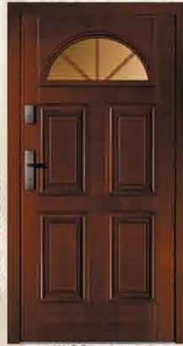
DZO 21 90