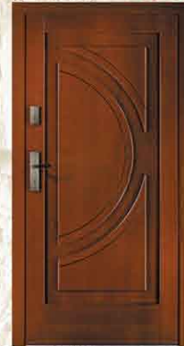
CAL 260 90, 80

netto 2616,- brutto 3191,52 netto 3300,- brutto 4026,00