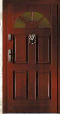
CAL 121 90

netto 2784,- brutto 3396,48 netto 3597,- brutto 4388,34