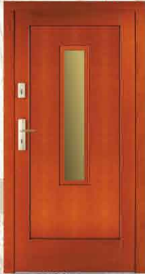
CAL 225 90, 80

sosna netto 2784,- brutto 3396,48 dąb netto 3490,- brutto 4257,80