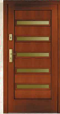
CAL 235 90, 80

netto 3148,- brutto 3840,56 netto 3752,- brutto 4577,44