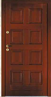
CAL 104 90, 80

sosna netto 2616,- brutto 3191,52 dąb netto 3300,- brutto 4026,00