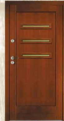
CAL 234 90, 80

netto 2784,- brutto 3396,48 netto 3490,- brutto 4257,80