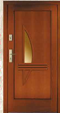
CAL 261 90

netto 3200,- brutto 3904,00 netto 3990,- brutto 4867,80