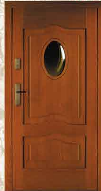
CAL 252 90, 80

netto 2784,- brutto 3396,48 netto 3490,- brutto 4257,80