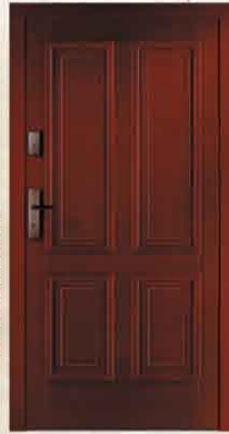
DZO 1 90, 80