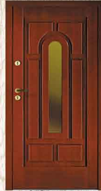
CAL 221 90

netto 2784,- brutto 3396,48 netto 3490,- brutto 4257,80