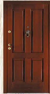
CAL 101 90, 80

sosna netto 2600,- brutto 3172,00 dąb netto 3300,- brutto 4026,00