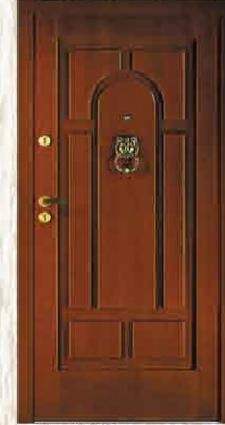
CAL 220 90

netto 2616,- brutto 3191,52 netto 3300,- brutto 4026,00